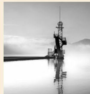
Anne-Laure (@nanou_photographie) diplômée des beaux arts à Tours (actuellement conseillère en vente à Annecy) s'est vu octroyer le prix de la plus belle photo selon l'équipe du projet IAE photo .

Le premier a remporté un polaroid et les deux autres une carte cadeau Fnac d'une valeur de 50€ chacune.