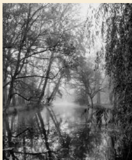
Lilou (@lilwhere_), étudiante en service civique dans la transition écologique à Tours a été choisie comme meilleure photo suite à une délibération du jury de l'IAE .